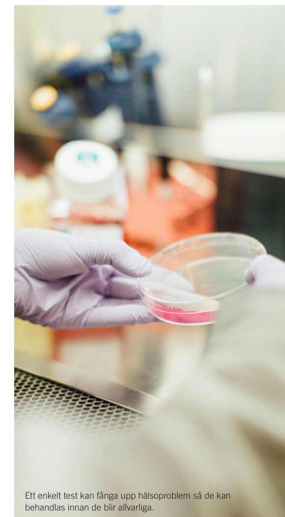
Ett enkelt test kan fånga upp hälsoproblem så de kan behandlas innan de blir allvarliga.